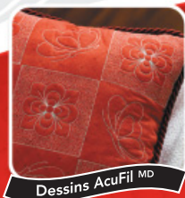
Dessins AcuFil MD