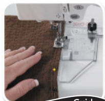
Guide tissu AcuGuide