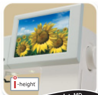
Écran i-height MD