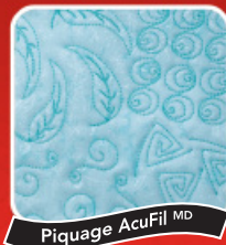
Piquage AcuFil MD