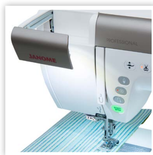
SYSTÈME D'ÉCLAIRAGE AMÉLIORÉ (1,6X PLUS BRILLANT) INTENSITÉ MAXIMALE