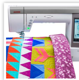
PLATEAU DE 11"