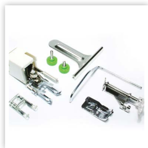
ENSEMBLE DE PIQUAGE INCLUS