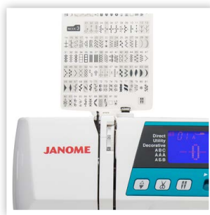
TABLEAU DÉTACHABLE DES POINTS