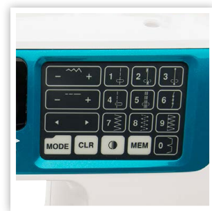
PLUSIEURS CARACTÉRISTIQUES PRATIQUES