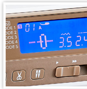
AFFICHAGE AMÉLIORÉ DE L'ÉCRAN LCD