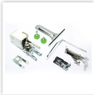
ENSEMBLE DE MATELASSAGE INCLUS