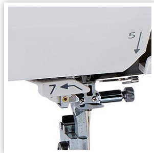
ENFILEUR D'AIGUILLE AMÉLIORÉ AVEC GUIDE-FIL #7