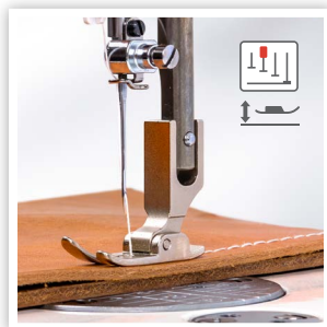
MODE FLOTTANT : JUSQU'À 3 MM DE SURÉLÉVATION