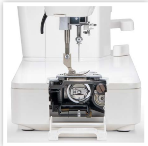
TÊTE PLUS MINCE ET HAUTEUR DU PLATEAU ABAISSÉE