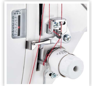
CONTRÔLE PRÉCIS : GUIDE-FIL POUR FILS ÉPAIS